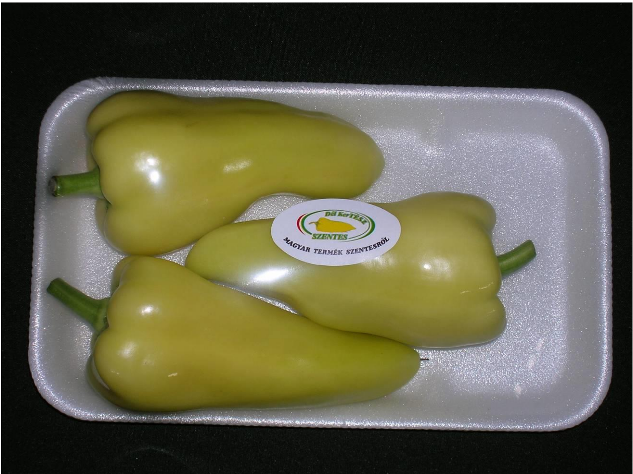
FEHÉR TÖLTENIVALÓ (TV) PAPRIKA