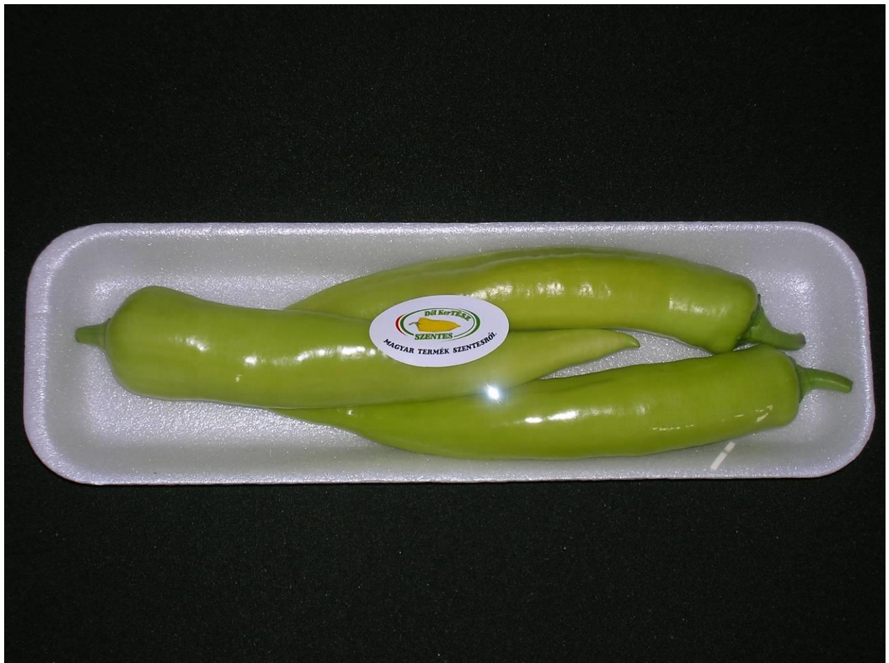
HEGYES ERŐS PAPRIKA